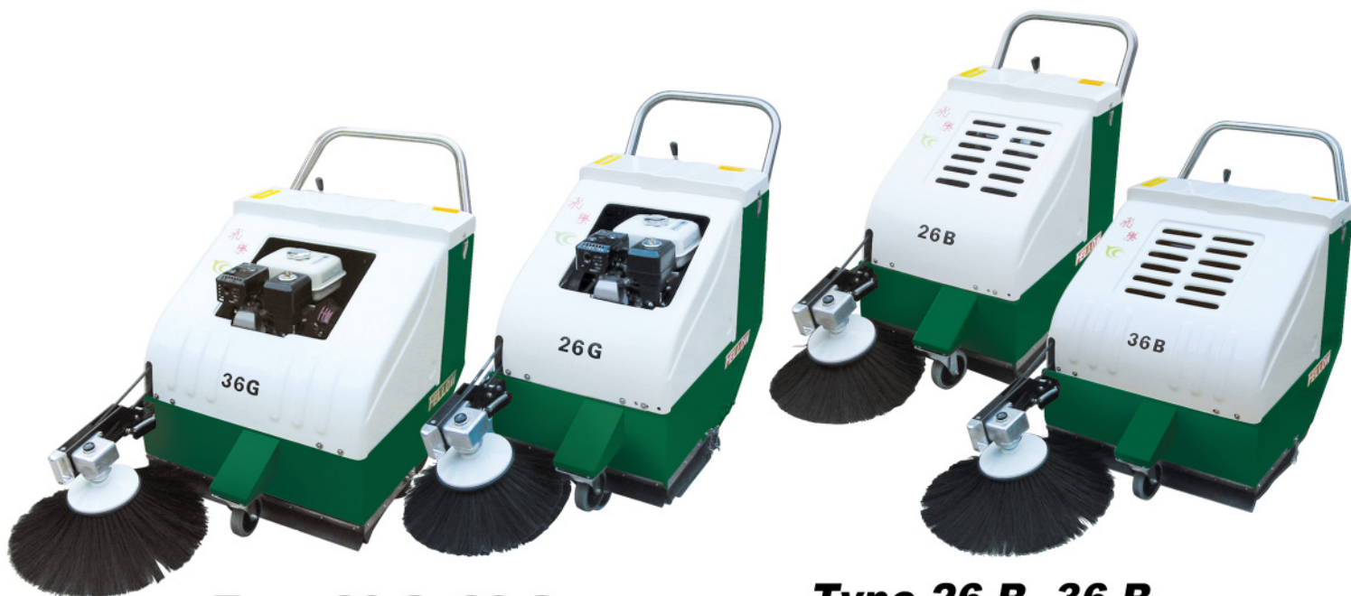
Type 26-G, 36-G (汽油引擎式)